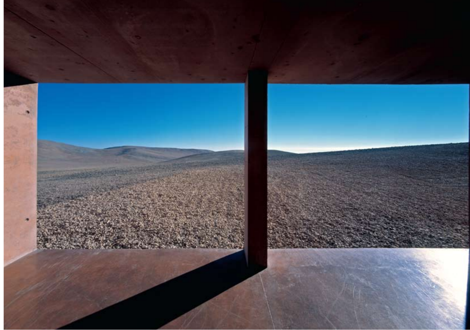
Acima: Vistas do hotel À esquerda: Área de entrada com piscina